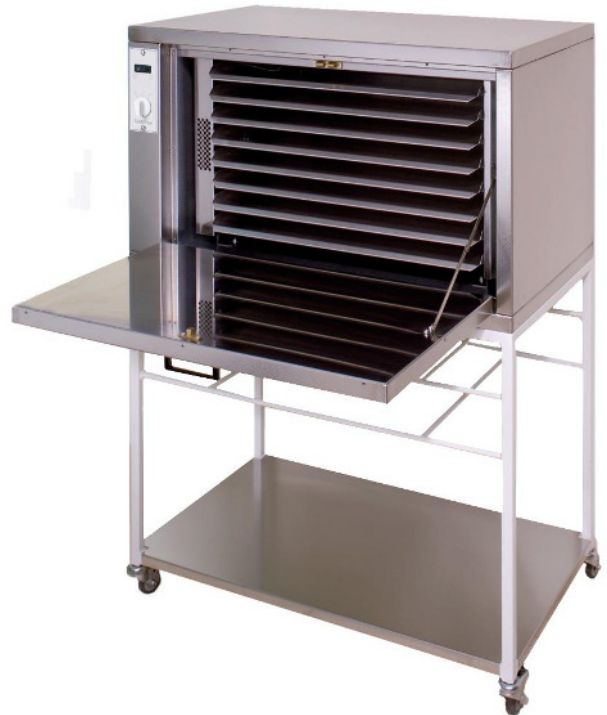
Untergestell (ZF6510) nicht im Lieferumfang von AF6570 enthalten.

Zusätzliches Aufnahmeblech (550 x 330 mm).