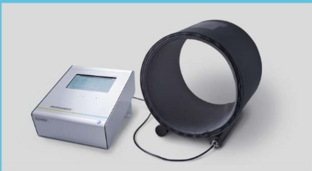
Zylinder, Ø 30 cm, zur Magnetfeldtherapie der Extremitäten und des Kopfes

MAG-Expert mit Zylinder Anthrazit, Ø 60 cm und Therapieliege inkl. Kopfkissen zur Magnetfeldtherapie der Wirbelsäule, der Hüfte und des ganzen Körpers