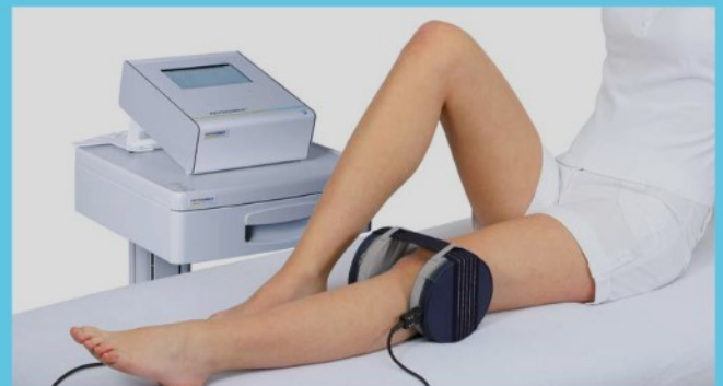
Magnetfeldtherapie mit dem Applikator-Set