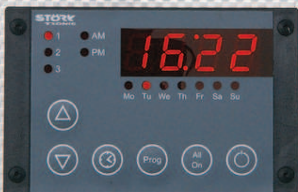
Option - Elektronik-Timer -